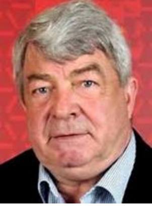
جان كلود غيسو

في العام 1990 صدر في فرنسا قانونٌ جديدٌ أُطلق عليه اسم قانون "غيسو" Gayssot Act، نسبةً إلى عرّاب القانون السياسي الفرنسي جان كلود غيسو "Jean- Claude Gaysot" عضو الحزب الشيوعي الفرنسي، وفرضَ هذا القانون عقوبات قاسية على إنكار وجود أو حجم الجرائم ضد الإنسانية التي عرّفها ميثاق لندن لعام 1945 في مادته التاسعة، والتي خضع على أساسها قادة الحزب النازي للمحاكمة العسكرية الدولية في نورنبرغ بين عامي 1945 و1946. أي أنّ القانون باختصار يعاقب من ينكر وجود أو حجم المحرقة النازية المعروفة بـ الهولوكوست. لم يكن قانون "غيسو" هو القانون الأوّل من نوعه؛ لكنه كان الأهم من جهة أهمية الدولة التي أصدرته، وصرامة العقوبات التي فرضها، وتكريس المصطلحات التي استعملها، فقد استعمل القانون في متنه مرات عديدة مصطلح "معاداة السامية"، و"جرائم ضدّ السامية". ولكن؛ ماذا تعني معاداة السامية؟ ومن أين أتى هذا المصطلح؟