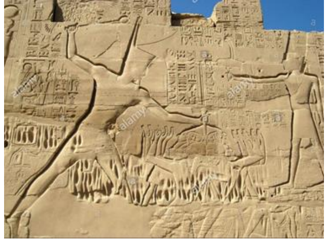
معركة مجدو على جدران معبد الكرنك

بناءً على الاكتشافات الأثرية والبحث العلمي التاريخي، فإنَّ هذه المنطقة كانت على مرِّ التاريخ وبسبب موقعها الجغرافي الفريد، ساحةً للنزال بين القوى العظمى في العالم. وكانت البداية مع مصر الفرعونية، تلك الإمبراطورية العظيمة والغنية التي بدأت بصورةٍ طبيعيةً بالتوسع مثلها مثل أيَّة إمبراطورية أخرى في العالم. وكان التوسع نحو الشرق الخصيب عبرَ بوابةِ أرض كنعان هو الطَّرِيق الأسهل بعد بسط سيطرتها على كامل وادي النيل، فأخضعت ممالك أرض كنعان لسيطرتها، وبذلك انفردت وحدها في الساحة، وحينها سجل التاريخ وقوع أوَّل معركة كبرى بين جيشين حقيقيين في سهل “مجدو” في فلسطين، وسمَّيت باسمه، وكانت بين تحالف الممالك الكنعانيةِ النَّائرة على الهيمنة المصرية بقيادة الملك “قادش”، وبين الجيش الفرعوني بقيادة “تحتمس الثالث”، وكانت أوَّل معركة في التاريخ يُستخدم فيها (القوس المركب)، وهي أيضاً أوَّل معركة في التاريخ يُحصى فيها عدد القتلى.