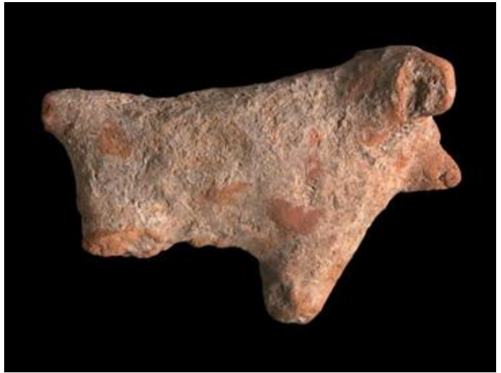
منحوتة لعجل، قرية أثرية قرب القدس

خطورة الموضوع تكمن في أنّ الباحثين التاريخيين قد ابتدعوا مرحلةً تاريخيةً اسمها مرحلة (العهد المقدس/ Biblical period of history) وهي تعود لقرابة 1200 ما قبل الميلاد؛ أي بالفترة التي تقول التوراة إنّ داود قد أنشأ إمبراطوريته العظيمة فيها.